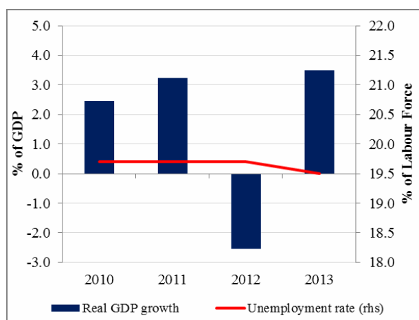
Slika 1: Rast BDP-a i nezaposlenost

Spoljne neravnoteže popuštaju. Deficit tekućeg računa smanjen je u 2013. godini na 14,6% BDP-a sa 18,7% prethodne godine, više usljed smanjenja uvoza, nego zbog poboljšanja izvoza. Pa ipak, trgovinski deficit ostaje jedan od glavnih strukturnih problema, koji odražava usku proizvodnu bazu lokalne ekonomije, nedostatak konkurentnosti i visoku zavisnost od uvoza. U 2013. godini dobri izvozni rezultat u oblasti električne energije proistekao je iz izuzetno povoljnih vremenskih prilika, pa je shodno tome izvoz u 2014. godini umjereniji. U prvoj polovini 2014. godine, trgovinski deficit povećao se za 4,5% u odnosu na prethodnu godinu jer je izvoz znatno brže umanjen u poređenju sa uvozom, pa se bazični učinak prethodnog izvoza električne energije izgubio. Kao rezultat toga, u četiri kvartala do juna deficit tekućeg računa blago je porastao do 14,8% BDP-a. Do sada, rizici su ublaženi u pogledu finansiranja. U 2013. godini, ukupni neto priliv kapitala bio je veći od deficita tekućeg računa, što je uzrokovano neto prilivom stranih direktnih investicija u iznosu 9,7% BDP-a i transferima. Ovo je omogućilo centralnoj banci da poveća svoje